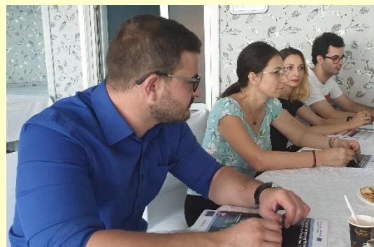
Vizită de pregătire a proiectului Lights ON!

s-a discutat despre urgența trimerii spre aprobarea forului de decizie a unei notificări, precum și a unui addendum la contractul de finanțare.