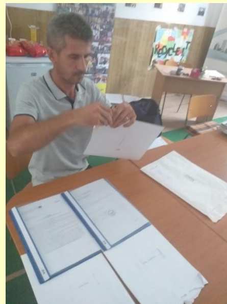
Deschidere oferte primite în cadrul procedurilor de achiziții publice

Planul de activități și bugetul proiectului prevăd o serie de achiziții realizate de către fiecare partener. Aceste achiziții sunt prevăzute în planul de contractare al proiectului, aprobat de către ofițerul responsabil de proiect desemnat de către BRCT Timișoara, în calitate de organism intermediar. Având în vedere și livrabilele specifice fiecărei activități, precum și plasarea lor în timp în cadrul proiectului, până la acest moment, respective 30.09.2019, doar Asociația Mod of Life a realizat o serie de achiziții de bunuri și servicii, finalizate cu contracte în cadrul proiectului. Achizițiile au fost grupate pe două categorii, respectiv achiziții directe și achiziții supuse procedurii de single tender.