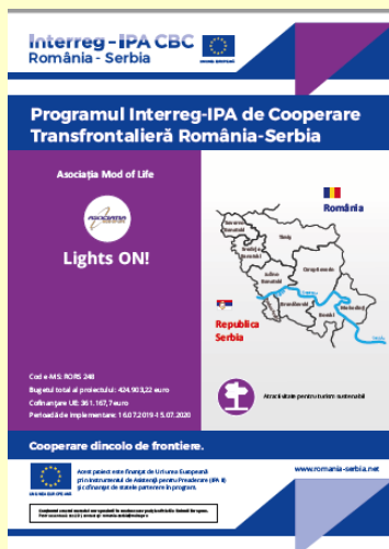
Posterul proiectului Lights ON!

A fost realizată pagina web a proiectului, livrabil esențial în WP Comunicare și legătura directă cu publicul atât pe viitor, cât și în prezent. Puteți găsi toate informațiile legate de proiect, precum și rezultatele așteptate, însoțite de detalii, fotografii, știri, etc, la adresa www.lights-on-danube.eu .