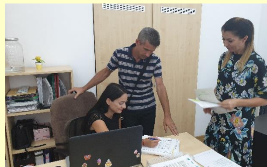
Întâlnire pentru înființarea Joint Steering Committee

s-a discutat despre urgența trimerii spre aprobarea forului de decizie a unei notificări, precum și a unui addendum la contractul de finanțare.