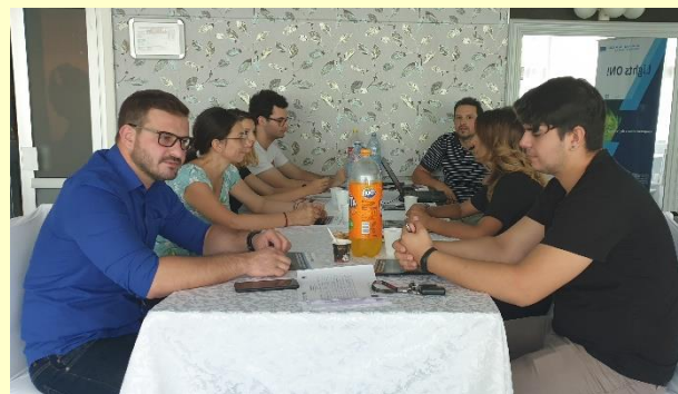
Vizită de pregătire a proiectului Lights ON!

- Stabilirea subiectului difuzărilor mass-media, felul în care să arate comunicatele de presă, anunțurile, news paperul proiectului, informațiile din pliante;