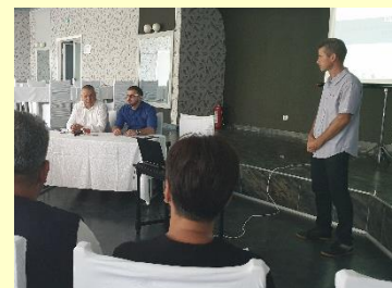
Conferința de lansare