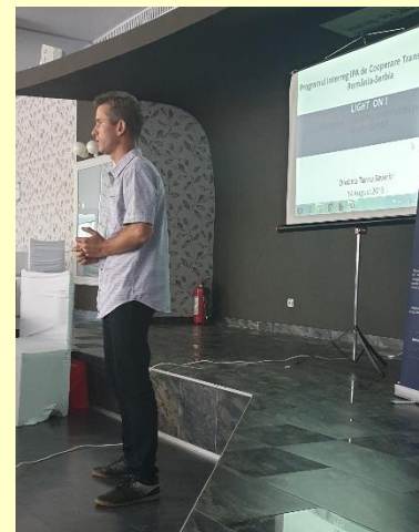
Managerul de proiect intervenție la Conferința de lansare

- Împreună cu reprezentanții departamentului First Level Control (FLC) și responsabilul de proiect din partea BRCT Timișoara s-a discutat despre structura bugetului proiectului, despre felul în care vor fi realizate procedurile de atribuire a contractelor, procedurile de derulare a activităților săptămânale și lunare, înființarea Joint Steering Committee precum și despre prevederile contractului de finanțare, despre addendumul necesar pentru a realiza o serie de modificări necesare pentru derularea în condiții optime a activităților proiectului.